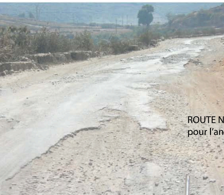
ROUTE NATIONALE... pour l'anecdote